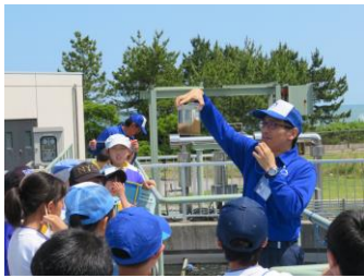
浄化センター見学